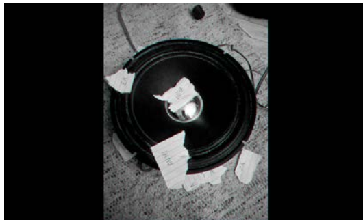
Yuri Tuma y Fabiana Vinagre Abrir imagen ↓