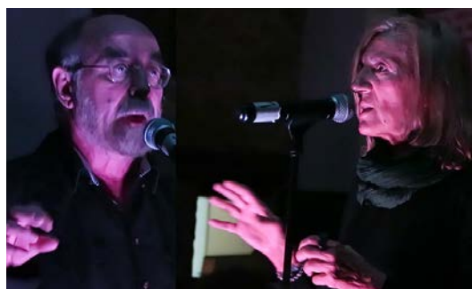
Dosentredos Abrir imagen ↓