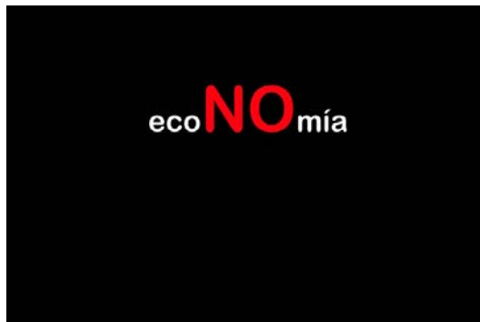
Cuca Canals Abrir imagen ↓