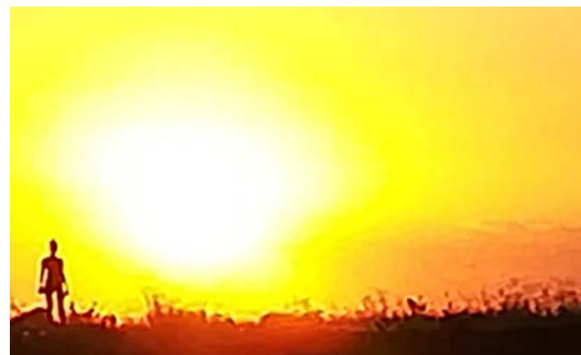
Lógica Difusa Abrir imagen ↓