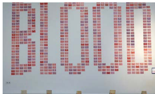
Isidro López Aparicio Abrir imagen ↓