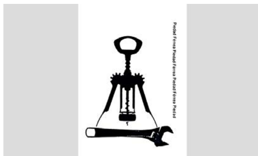
Julia Otxoa Abrir imagen ↓