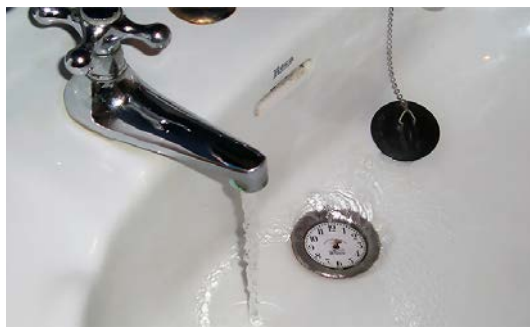
Teo Serna Abrir imagen ↓