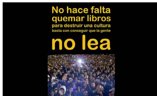
Rogelio López Cuenca Abrir imagen ↓