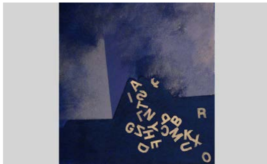
Isabel Jover Abrir imagen ↓