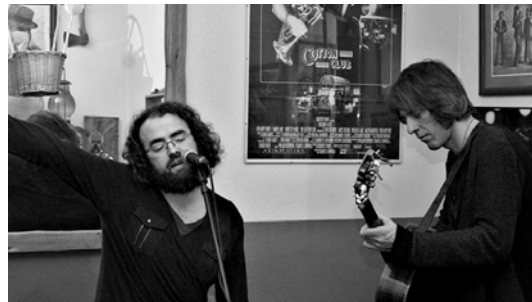
La Gran Trazada Abrir imagen ↓