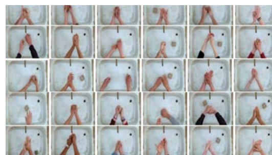
Jaume Pitarch Abrir imagen ↓