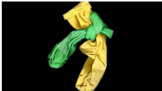
Jaime Vallauré Abrir imagen ↓