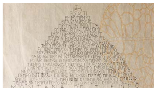
Laura Lio Abrir imagen ↓