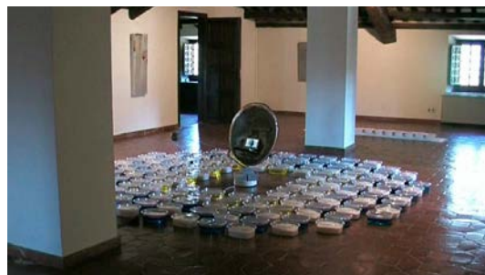
Said Messari Abrir imagen ↓