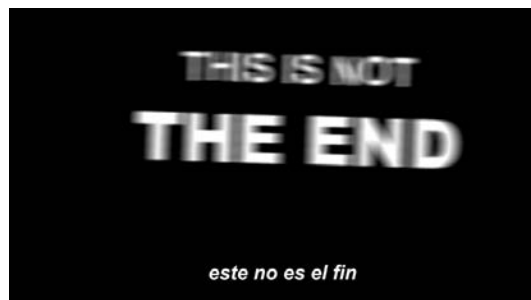
Ignasi Aballí Abrir imagen ↓